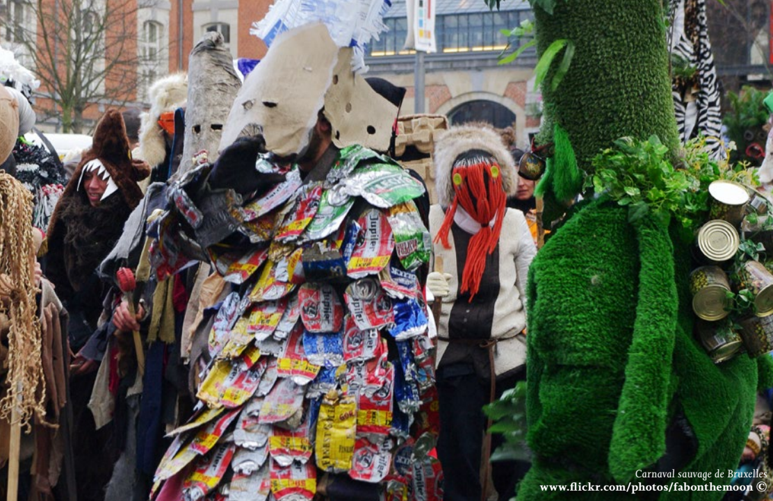
Carnaval sauvage de Bruxelles