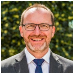
Georges Engel, Buergermeeschter